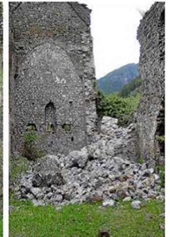
Muro caído de la iglesia de la Trinidad de Canfranc.