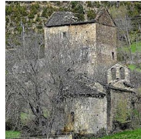
La torre señorial de Aruej ha perdido en los últimos días la mayor parte de su tejado.